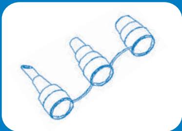
Bicos para Inflar